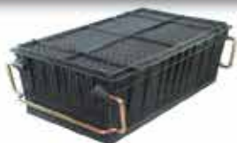
COUVERCLE POUR PANIER 410

Résistance aux hydrocarbures, au Perchloréthylène à 120° et aux solvants A3 à 140°