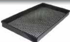
PLATEAU ATP 4x4 Utilisable en panier 410

Maillage 10x10 Cloisonnable avec croisillons H20 L : 365 / l : 200 / h : 30 h utile intérieure : 22