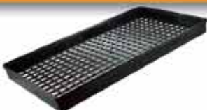
PLATEAU ATP 10X10 Utilisable en panier 410

Maillage 10x10 Cloisonnable avec croisillons H20 L : 365 / l : 200 / h : 30 h utile intérieure : 22