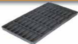
PLATEAU ATP 2x2 / 40 Utilisable en panier 410

13 logements Longueur utile : 178 mm Diamètre maxi pièces : 22 mm L : 370 / l : 190 / h : 25