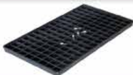
PLATEAU ATP 2x2 / 128 Utilisable en panier 410

Maillage 2x2 64 logements 45 x 20 x 10 L : 365 / l : 200 / h : 17