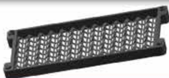
PLATEAU ATP 13 cases Utilisable en panier 410

Maillage 4x4 Cloisonnable avec croisillons H20 L : 365 / l : 200 / h : 30 h utile intérieure : 22