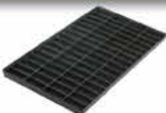
PLATEAU ATP 2x2 / 64 Utilisable en panier 410

Maillage 2x2 40 logements 68 x 20 x 10 L : 365 / l : 200 / h : 17