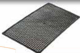
GRILLE 4x4 Utilisable en panier 410